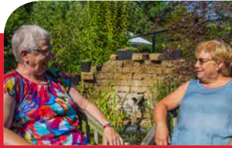
Hoogste tijd voor een lokaal dienstencentrum voor senioren