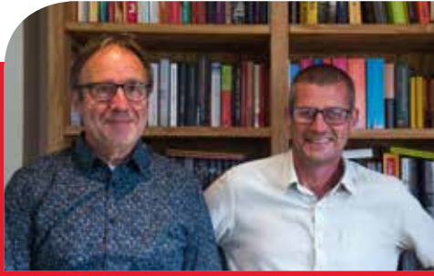
'Al een geluk dat het Molsbroek nog niet verkaveld is'