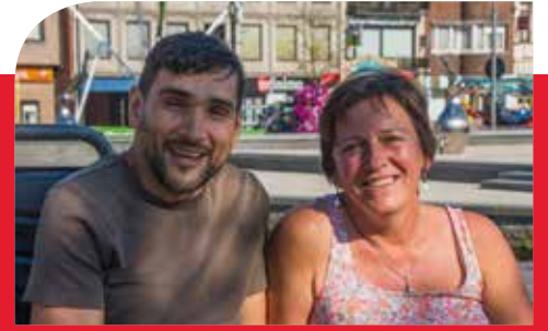
'Woonattest voorkomt huisjesmelkerij'